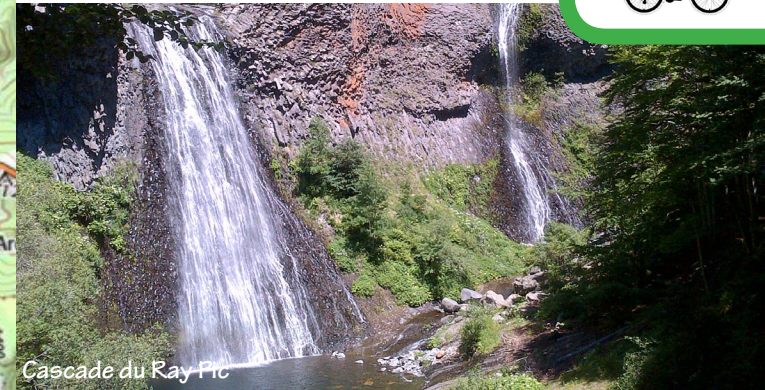
Cascade du Ray Pic

4 - Sur la ligne de partage des eaux - Facile