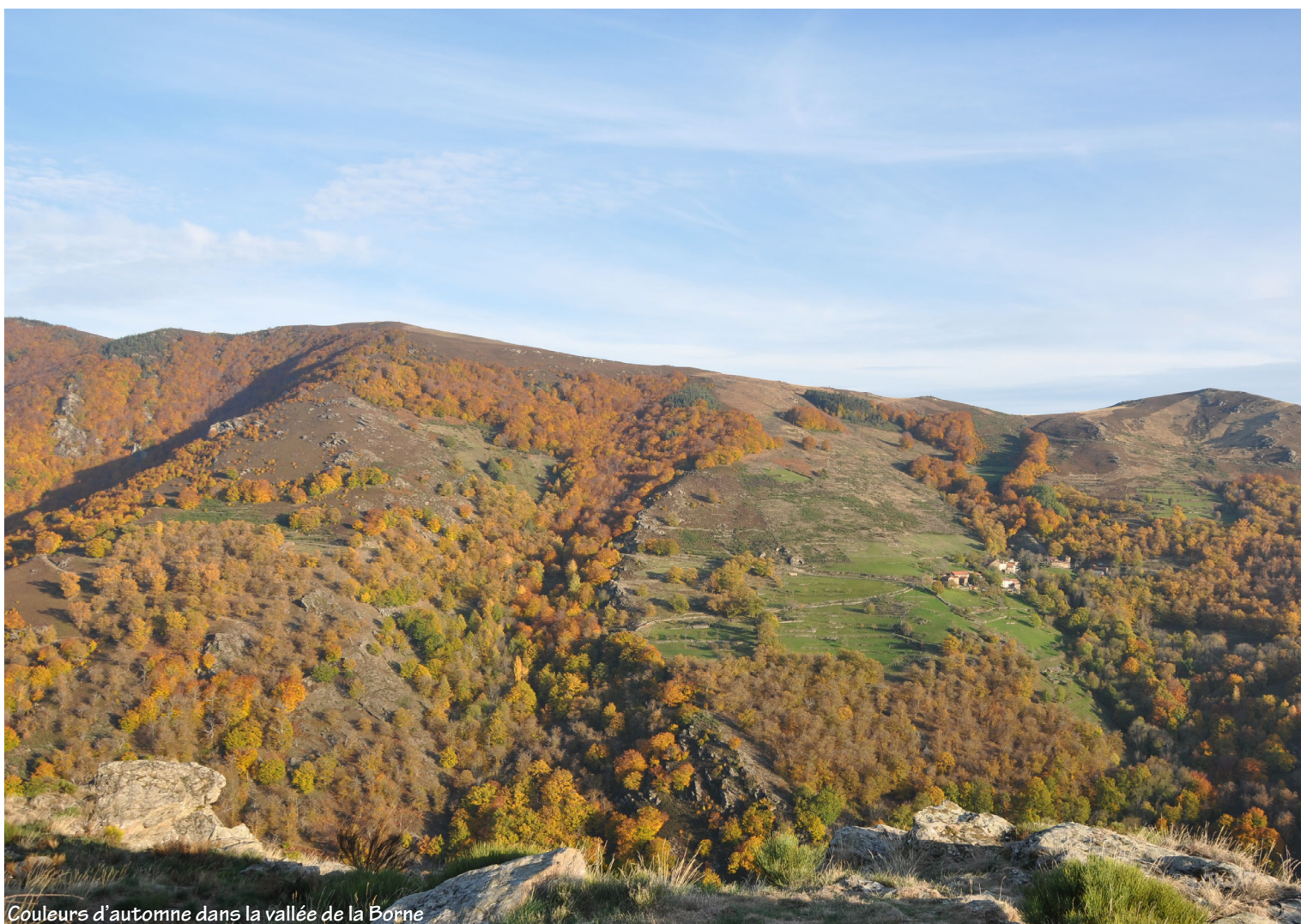
Couleurs d'automne dans la vallée de la Borne