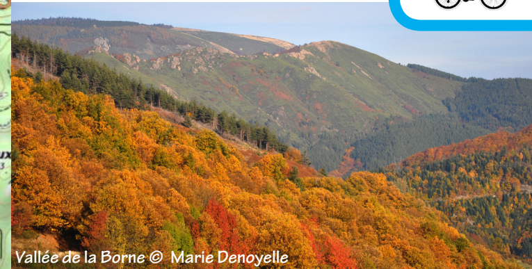
Vallée de la Borne