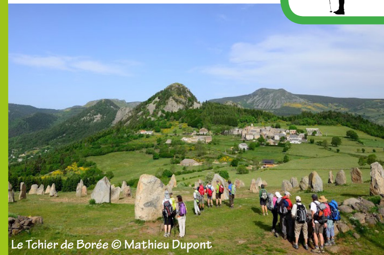
Le Tchier de Borée