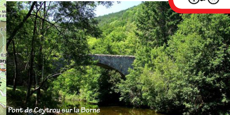
Pont de Ceytrou sur la Borne