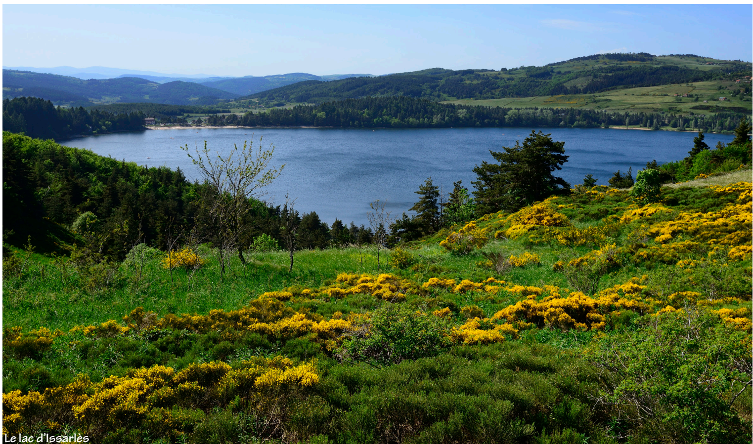
Le lac d'Issarlès