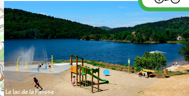
Le lac de la Palisse