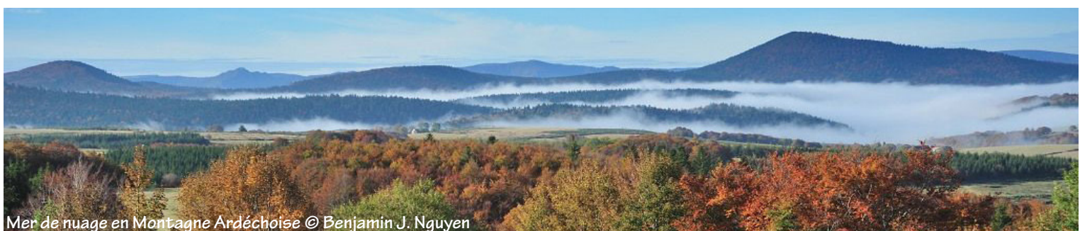
Mer de nuage en Montagne Ardéchoise