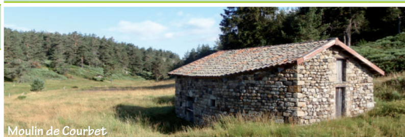
Moulin de Courbet