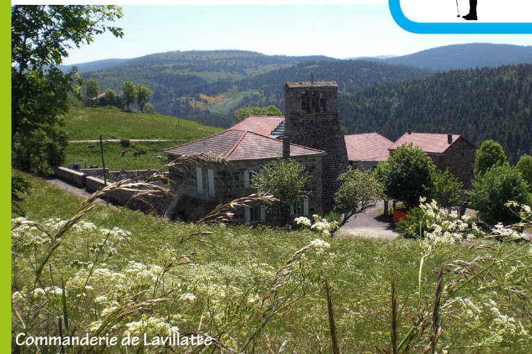
Commanderie de Lavillatte